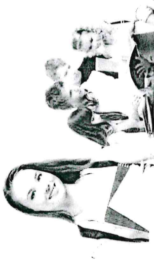
© Fotolia.com - Vaha Vahya - #10530454

Kinder, Jugendliche und junge Erwachsene können BuT-Leistungen erhalten, deren Familien oder gesetzliche Vertreter eine der folgenden staatlichen Leistungen beziehen: